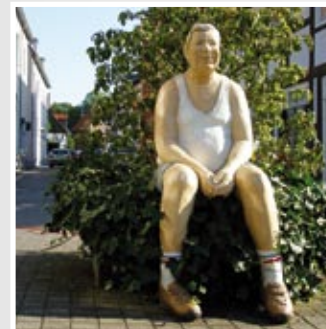
WIEDENBRÜCKER ORIGINAL, Kirchstraße