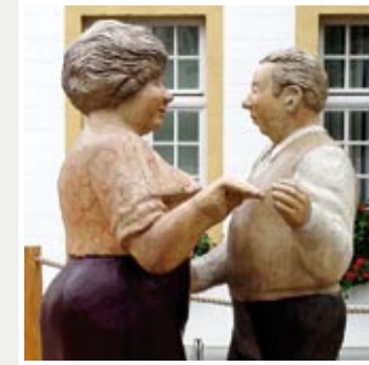
TANZ IN DEN MORGEN, Marktplatz