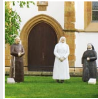
FRANZISKANER, 4 NONNEN, Marienkirche